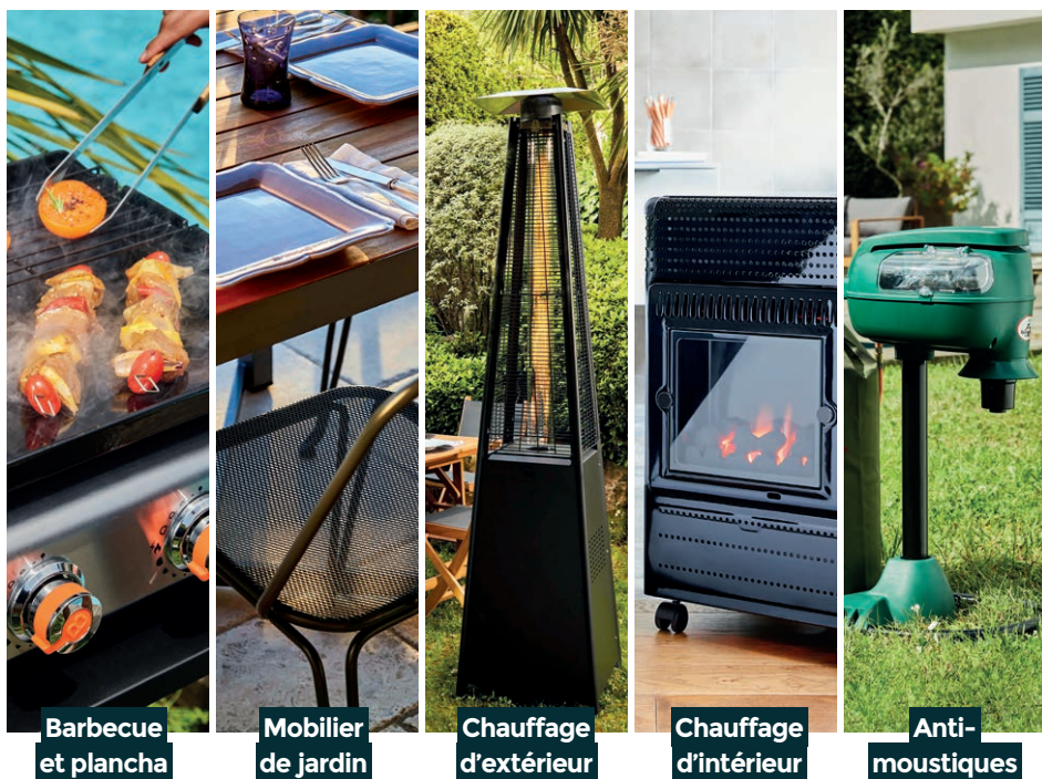
Barbecue et plancha

Véritable référence du confort et du loisir outdoor, Favex réunit tous les équipements indispensables de la maison au jardin. Du parasol chauffant à l'anti-moustiques en passant par le barbecue ou la plancha, depuis plus de 40 ans les univers Favex invitent au partage et à la détente pour transformer le quotidien.